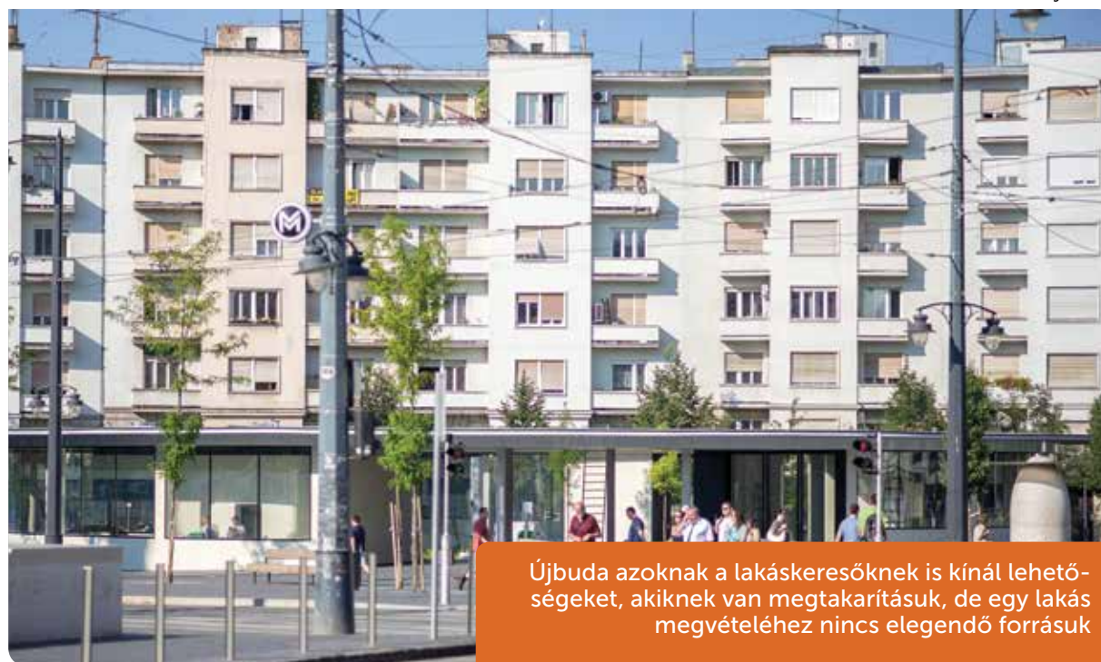
Újbuda azoknak a lakáskeresőknél is kínál lehetőségeket, akiknek van megtakarításuk, de egy lakás megvételéhez nincs elegendő forrásuk

felmondja a szerződést. A szerencsés kérelmező öt évre havi 452 forint/négyzetméter bérlati díjért bérelhet lakást a kerülettől. (Az önkormányzati lakások lakbérének mértékét szociális helyzet alapján, költségelven vagy piaci alapon állapíthatják meg a lakások és helyiségek bérletére vonatkozó törvény 2006-os módosítása szerint. Budapesten a piaci alapú bérlati díja négyzetméterenként jellemzően 1000 forint körül alakul, a költ-